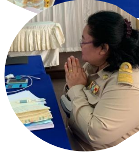
จำนวนโครงการทั้งหมด